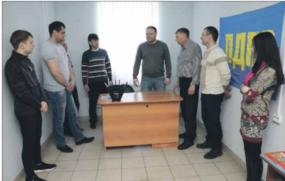
Общественная приёмная ЛДПР в городе Кузнецке находится по адресу: улица Калинина, д. 154, 3 эт., каб. 38. Режим работы: понедельник — с 09:00 до 11:00, суббота — с 10:00 до 12:00.