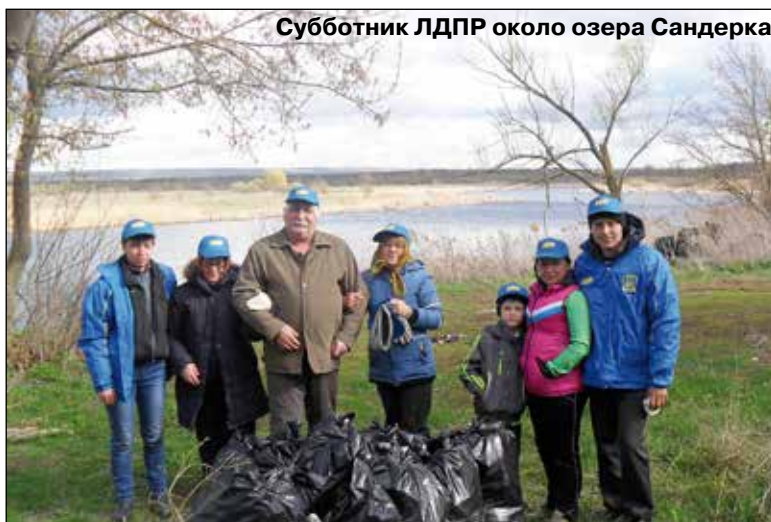
Субботник ЛДПР около озера Сандерка

Сообщаю также, что жителями данного района собрано порядка 25 подписей для начала процедуры присвоения озеру Сандерка статуса памятника природы регионального