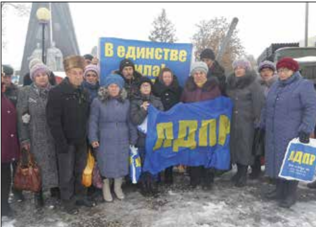
с. Русский Камешкир